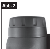
Abb. 2 Augenmuschel in Stellung "unten"