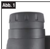
Abb. 1 Augenmuschel in Stellung "oben"

Fokussieren Sie ein entferntes Objekt (z.B. eine Mauer, Äste usw.) mit Hilfe des Fokussierades, bis das Objekt eine optimale Schärfe erreicht. Jetzt sollte das Fernrohr an Ihr Auge angepasst sein. Sie können das Fernrohr nun durch einfaches Drehen des Fokussierades auf jede beliebige Distanz einstellen.