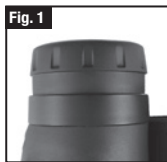
Conchiglia oculare in posizione "su"

Il monoculare Bushnell® Legend® Ultra HD è dotato di una conchiglia oculare ripiegabile, ideata per garantire la massima comodità e per escludere fonti luminose estranee. Per chi non indossa occhiali da vista, piegare la conchiglia oculare verso l'alto, facendola ruotare in senso antiorario fino a che essa non risulti completamente bloccata in posizione "su" (Fig. 1). Per chi indossa occhiali da vista, verificare che la conchiglia si trovi in posizione abbassata; in tal modo, sarà possibile avvicinare maggiormente gli occhi alle lenti e osservare quindi l'intero campo visivo. Per abbassare la conchiglia oculare dalla massima posizione "su", far ruotare in senso orario (Fig. 2). La conchiglia oculare può altresì rimanere in posizione "intermedia" tra i livelli massimi superiori e inferiori, risultando così più adatta in base al tipo di utente.