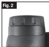
Conchiglia oculare in posizione "Giù"

EVITARE DI OSSERVARE IL SOLE DIRETTAMENTE ATTRAVERSO IL MONOCULARE, IN QUANTO POTREBBERO CONSEGUIRNE GRAVI DANNI PER GLI OCCHI