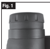
Ocular na posição "para cima"

A calha Picatinny permite a montagem de um conjunto de luzes e miras tácticas.