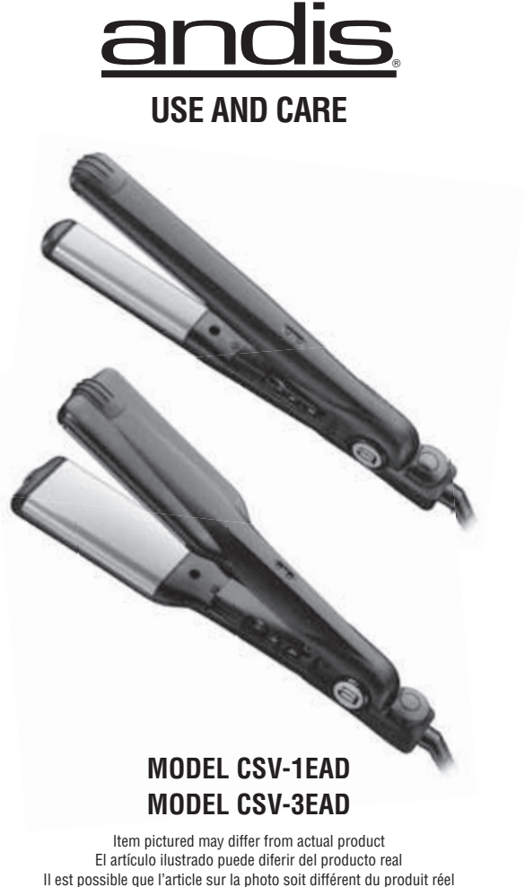
MODEL CSV-1EAD MODEL CSV-3EAD

©2011 Andis Company 1800 Renaissance Blvd., Sturtevant, WI 53177 1-800-558-9441 Canada: 1-800-335-4093 info@andisco.com www.andis.com