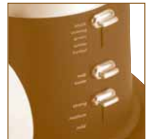
IMAGEN 3: SELECCIONES PARA EL TÉ