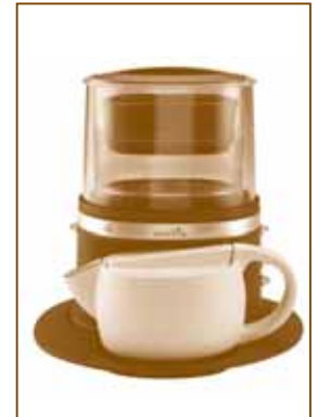
IMAGEN 2: LA CANASTA DE FILTRO FLOTARÁ