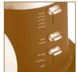
PICTURE 3: TEA SETTINGS