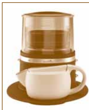
IMAGEN 4: LA CANASTA DE FILTRO SE SUMERGIRÁ