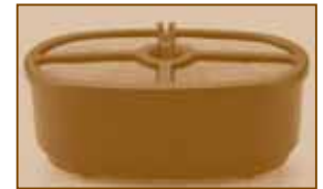
IMAGEN 1: LA CANASTA DE FILTRO