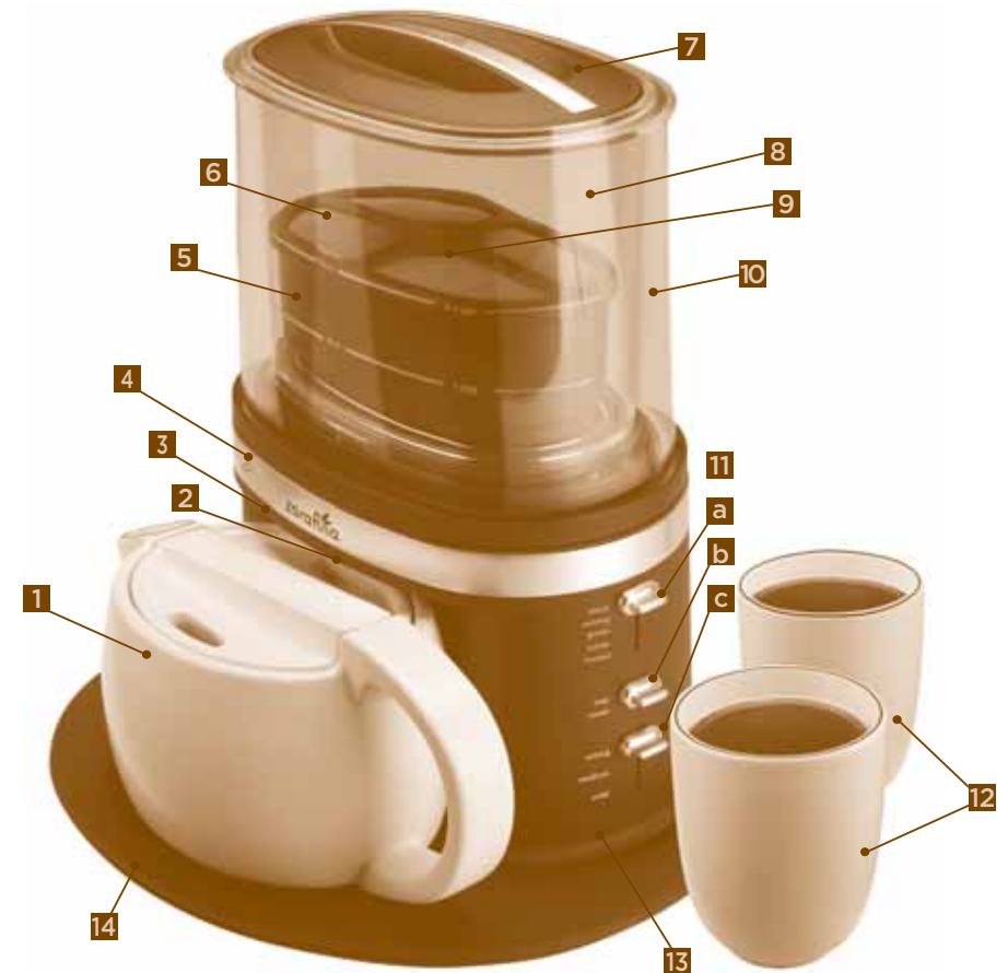
DIAGRAMA DE LA PARTES

Visit our website at www.zarafina.com and discover the secret to infusing the perfect cup of tea. You will also find a rich blend of gourmet recipes, entertaining tips and the latest information on ZARAFINA™ products.