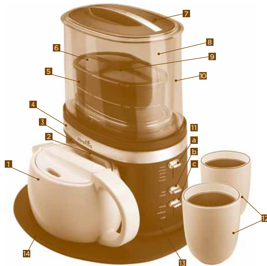
DIAGRAM OF PARTS

Visite nuestro sitio web en www.zarafina.com y descubra el secreto para preparar una perfecta taza de té. También encontrará una excelente combinación de recetas gourmet, consejos para recibir visitas y la última información sobre los productos ZARAFINA™.