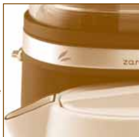
IMAGEN 5: LA LUZ INDICADORA